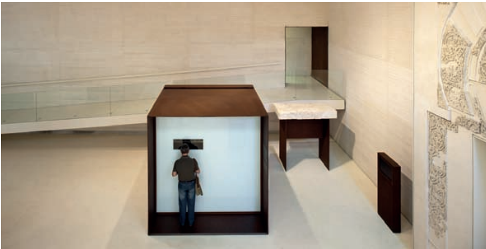
Figura 4 (abajo). Museo Madinat al-Zahra de Córdoba. Autores: Frade Arquitectos y Nieto y Sobejano.