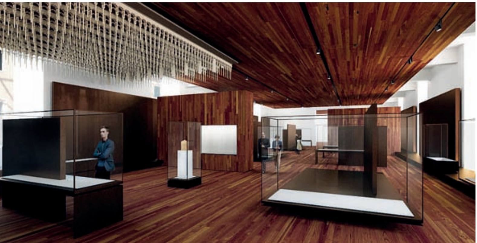
Figura 2. Proyecto museográfico del Museo Arqueológico Nacional. Autores: Frade Arquitectos y UTE Acciona-Empty.

Ningún museo debe girar alrededor de los recursos, ni estos deben erigirse como protagonistas de la exposición. Obviamente, las salas ocultarán unos medios que la tecnología actual nos ofrece, pero siempre al servicio de las piezas, es decir, hay que establecer una distinción entre la tecnología que realmente aporta ventajas a la instalación y la que sirve simplemente para convertir un museo en un espectáculo al margen de las colecciones.