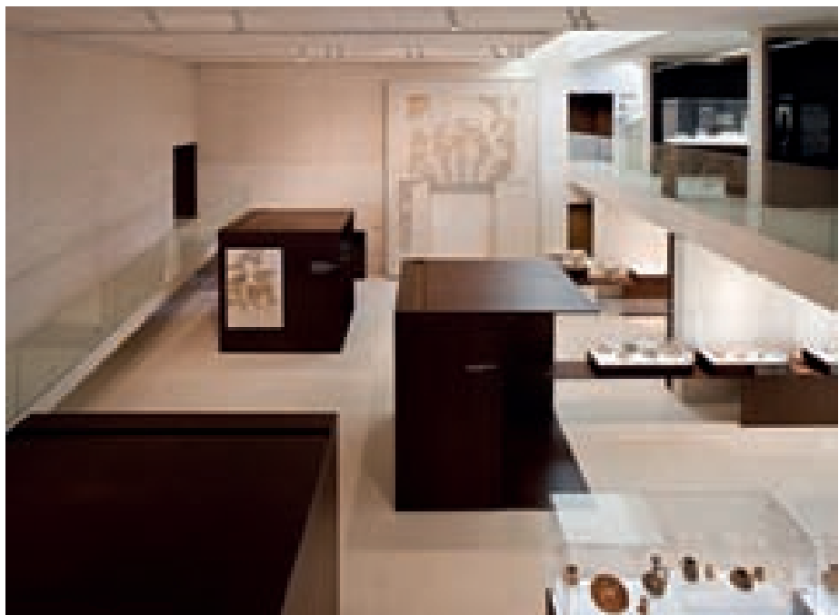
Figuras 5 y 6 (centro y abajo). Museo Madinat al-Zahra de Córdoba. Autores: Frade Arquitectos y Nieto y Sobejano.