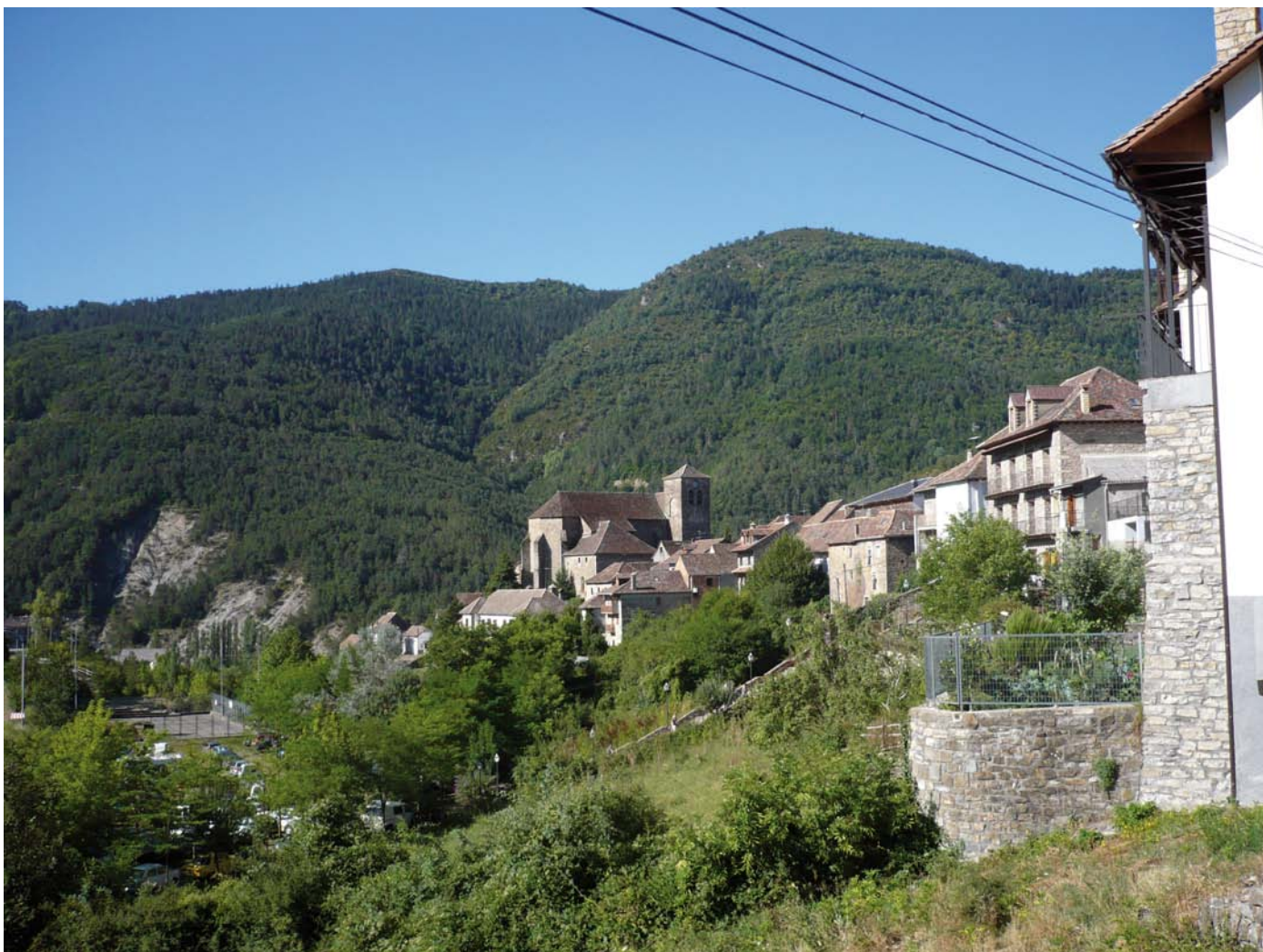
Figura 4. Ansó (Huesca) con su iglesia parroquial, sede del Museo Etnológico.

de lo social instituido. Ojo divino como imagen de un sistema de referencia desde el que mirar y describir el mundo de manera certera y objetiva. Y que el principio de indeterminación de Heisenberg, formulado en 1927, también desautoriza, en este caso desde la mecánica cuántica, al demostrar la imposibilidad de fijar con exactitud posición y velocidad de una partícula elemental, ya que el instrumento de medida siempre modifica lo observado.