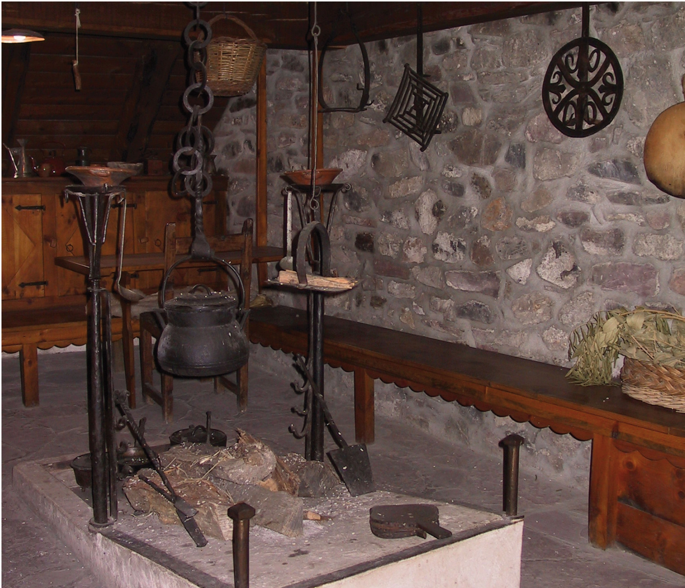
Figura 3. Cocina del Museo Etnológico de San Juan de Plan (Huesca).

Artículo 7. Garantizar el derecho a la memoria de grupos y movimientos sociales y apoyar acciones de apropiación social del patrimonio y de valorización de los distintos tipos de museos, como museos comunitarios, ecomuseos, museos de territorio, museos locales, museos memoriales (resistencia y derechos humanos) y otros.» No es difícil vislumbrar en esas inten-