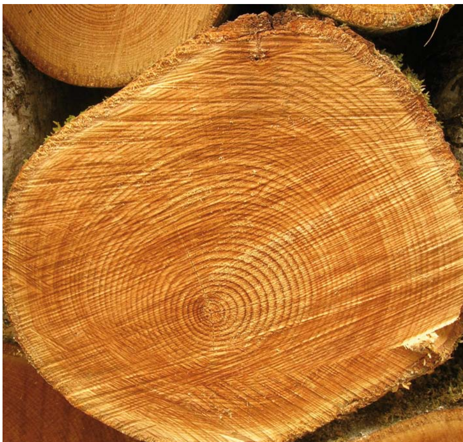
Figura 6. Por los bosques del Pirineo aragonés.

La evidencia universal de la condición filial la recoge Adrienne Rich en su obra Nacemos de mujer ; todo un clásico publi-