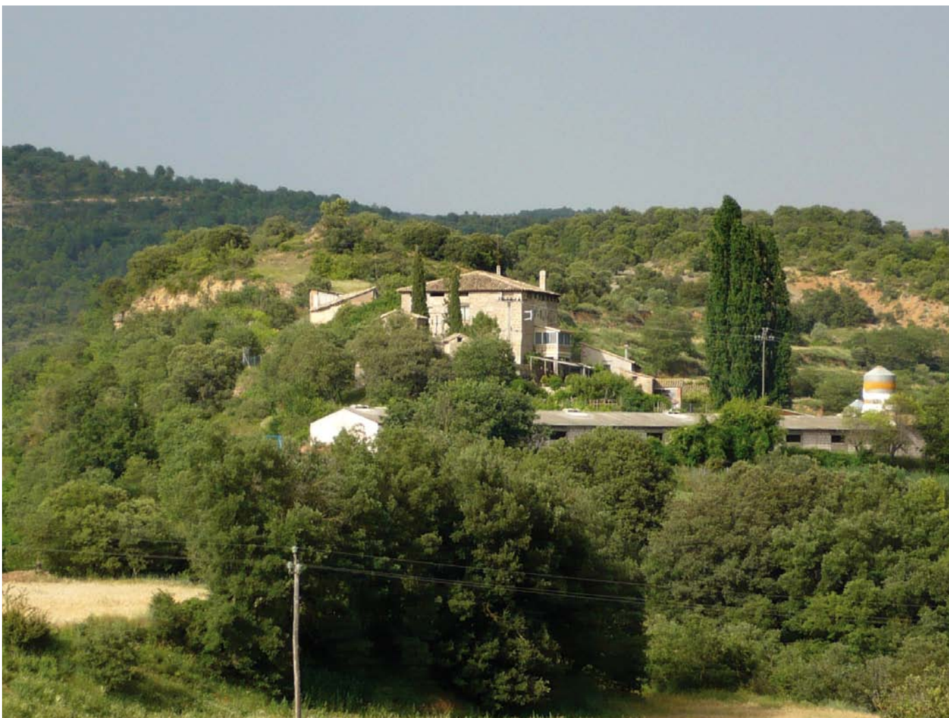
Figura 5. Museo Etnológico del Mas de Puybert (Huesca).

que este se produce, y su persistencia en decantarse singularmente por los lugares más sojuzgados y apartados de los centros de poder, nos acerca a lo que se conoce dentro de la filosofía contemporánea como el «giro ético». Hay una clara elección sobre cómo hacer ciencia, dónde procurar conocimiento. El humus que sirve de excelente mantillo para el crecimiento de un mejor saber es el lugar de los subyugados: «Para lograr un compromiso con sentido que pueda ser personalmente compartido y que sea favorable a los proyectos globales de libertad finita, de abundancia material adecuada, de modesto significado en el