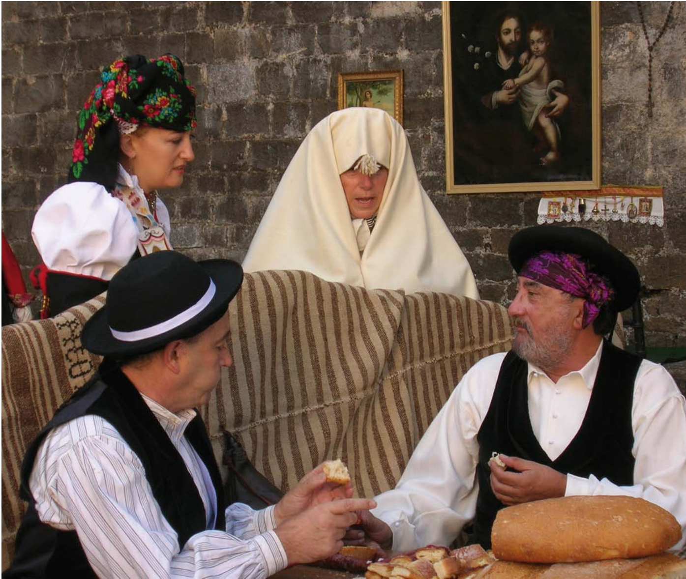
Figura 1. Ansó (Huesca), 2008. Fiesta de Exaltación del traje ansotano.

que tiene el vocablo: lo masculino o lo femenino, que en niveles anatómofisiológicos se asocian con la posesión de la pareja de cromosomas XX, llamada persona mujer o XY llamada persona hombre o varón, si bien debemos aceptar que existen otras posibilidades combinatorias de dichos cromosomas, ampliando, aunque de forma no mayoritaria, la diversidad sexual y la consiguiente dificultad para asignar nombre