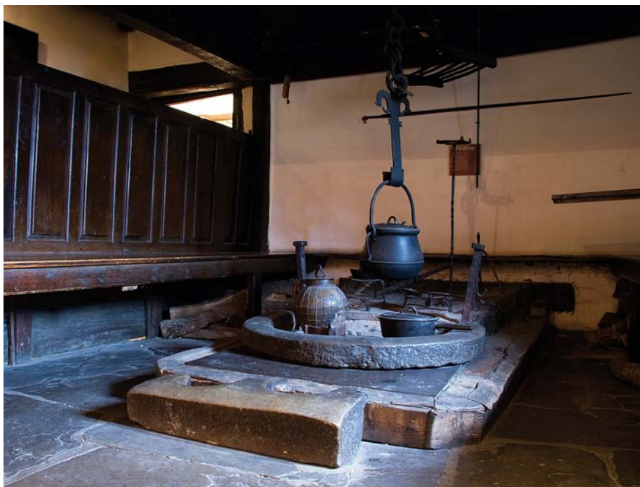
Figura 8. Cocina del Museo Etnológico de Serrablo (Sabiñánigo, Huesca).

Se nos ofrece una buena oportunidad para desarrollar un proyecto de forma coherente, que recoja las nuevas perspectivas que se han incorporado al mundo científico en los últimos años, que se atreva a sostener que la herencia de las madres reúne sobrada dignidad para ser calificado de patrimonio cultural.