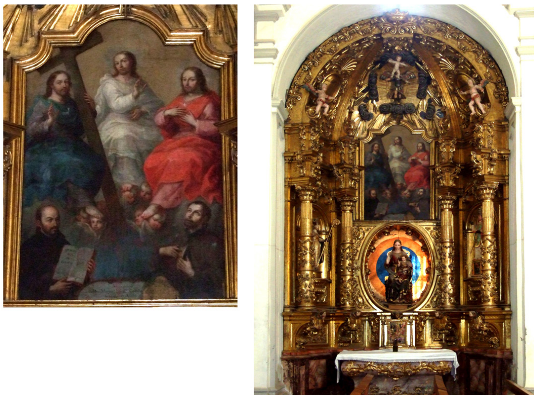
Figura 2. Retablo de la Virgen de la Nieves. Tomás Martínez Puelles. Año 1754. Detalle del lienzo de la Santísima Trinidad vinculado con el estilo del pintor mexicano Miguel Cabrera.

Siguiendo las órdenes del comitente, su calle central estuvo presidida por el camarín, con embocadura oval, para la Virgen de las Nieves, sobre el que se colocó el lienzo con el pasaje de «La aparición de la Trinidad a San Ignacio de Loyola y a San Francisco Javier» que aparece descrito en el envío y, en el remate, una pequeña imagen de San Miguel 11 .