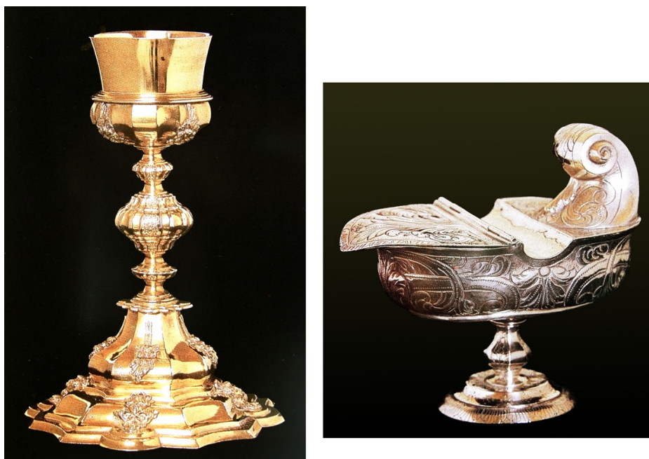
Figura 5. Cáliz y naveta de plata del legado remitido por Gambarte de la parroquia de San Pedro de Puente la Reina.

HIJO DE ESTA VILLA. A[BRI]L Y MÉX[I]CO 27 DE 1750 y los punzones O/ARXA, correspondiente al platero Antonio de Rojas, GONZA/LES del ensayador mayor Diego González de la Cueva, más las marcas de la ciudad de México y del pago del quinto real (fig. 5).