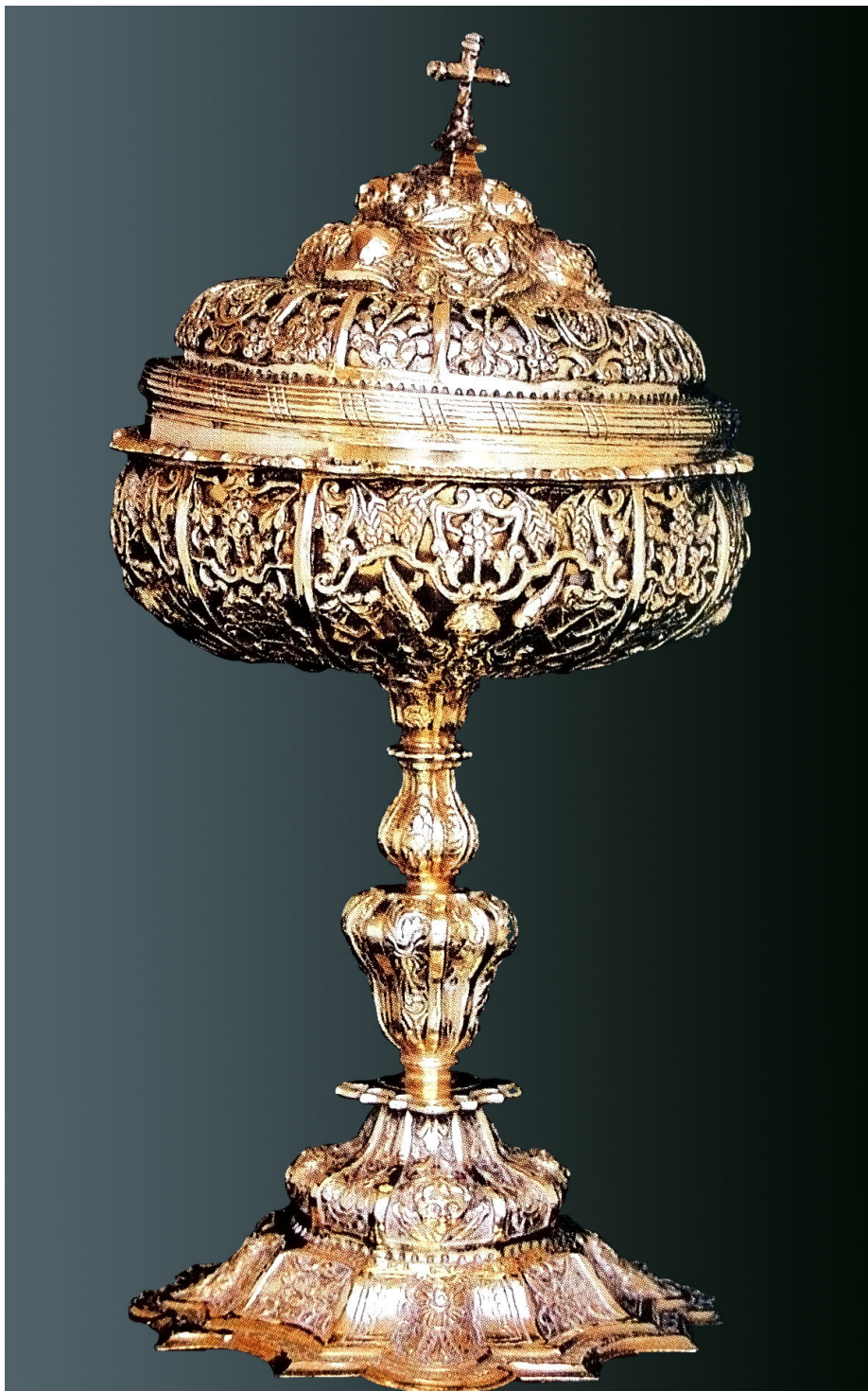
Figura 6. Copón de plata sobredorada del convento de Santa Clara de Estella.

de perfil mixtilíneo muy elevada, astil con nudo de pera y bulbo superior y una gran copa semiesférica con tapadera rematada en cruz de sección romboidal. Se encuentra profusamente decorado con motivos de flores, querubines y símbolos eucarísticos e incluye la inscripción: MIGUEL FRANCISCO GAMBARTE. En su reverso son visibles los punzones del ensayador Diego González -GNZ-, de la ciudad de México y del pago del quinto real (Heredia Moreno, MC., Orbe Sivatte, M. y A., 1992: 92) (fig. 6).