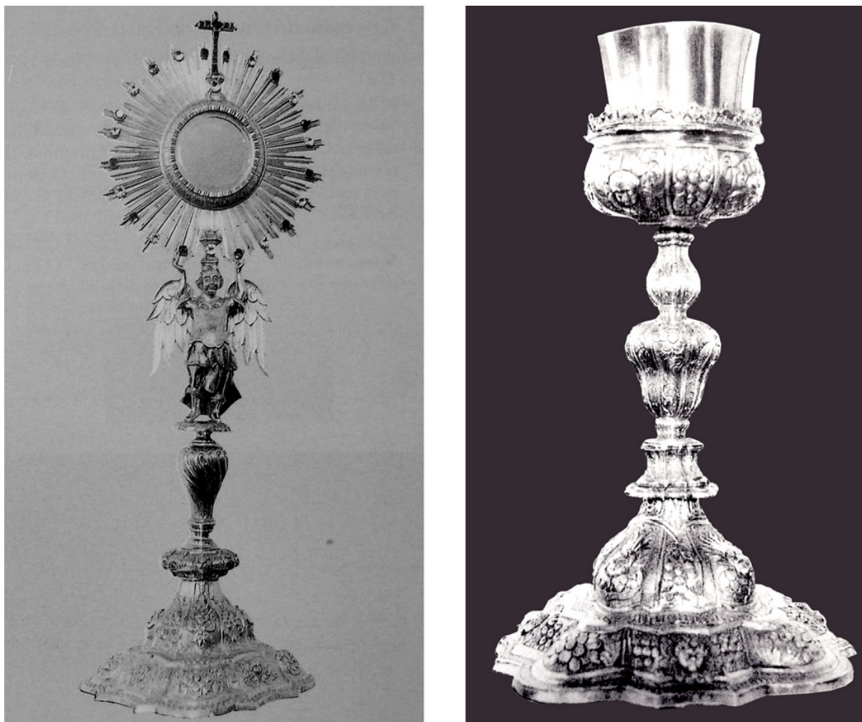
Figura 8. Custodia y cáliz de plata sobredorada del convento de las madres capuchinas de Tudela, remitidos desde México en 1754.

Concluía así, lo que fue una práctica muy habitual en muchos indianos que lograron triunfar en ultramar: remitir ricos ajuares artísticos a distintas instituciones religiosas peninsulares. Este hecho, que se repitió incesantemente entre los siglos XVI al XVIII, frecuentemente obedeció tanto a razones de carácter devocional –acto de agradecimiento a Dios por sus fortunas– como también como un simple gesto de prestigio social, es decir, como una simple práctica de exhibicionismo ante sus paisanos, haciendo ostentación de sus bienes. Sin embargo, ya fuera por uno u otro motivo, todos ellos contribuyeron, en buena medida, al engrandecimiento artístico de su patria chica, a la que aún se encontraban unidos por lazos de tipo afectivo 18 .