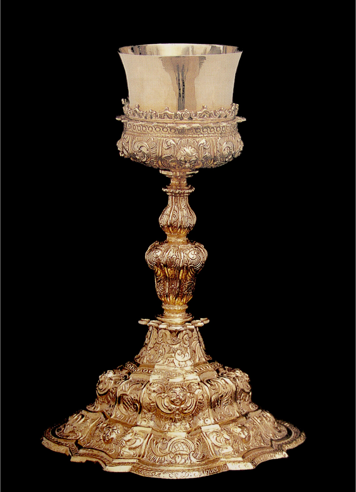
Figura 9. Cáliz de plata sobredorada del convento de Concepcionistas Recoletas de Estella, remitidos desde México en 1755.