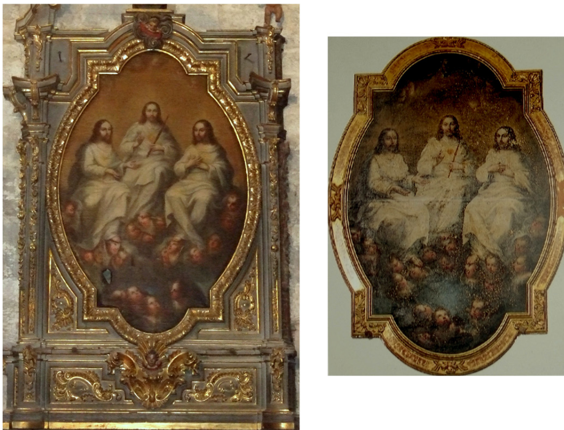
Figura 7. La Santísima Trinidad. Iglesia de Santiago de Puente la Reina y del sotacoro del convento de Santa Clara de Estella.

La custodia es de plata sobredorada y presenta base de perfil mixtilíneo muy elevada, astil con nudo bulboso y sobre él una figura de san Miguel arcángel sosteniendo el viril. Éste presenta rayos biselados de diferentes tamaños y se corona con cruz latina recubierta de pedrería. Incluye la inscripción: PARA EL CONVENTO DE LAS RR MM CAPUCHINAS DE LA CIUDAD DE TUDELA EN EL REINO DE NAVARRA, pero carece de marcas (Heredia Moreno, MC., Orbe Sivatte, M. y A, 1992: 91).