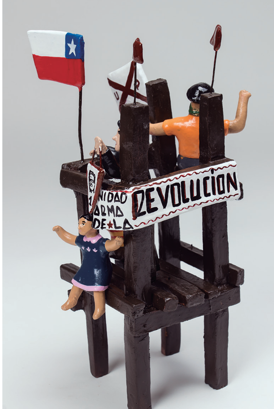
Detalles de la escena "¡A parar el golpe de Estado!" Greta Cerda, 2022