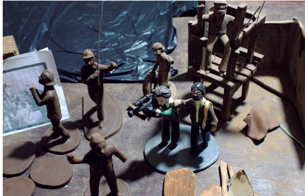
Modelado de piezas de la escena "¡A parar el golpe de Estado!"