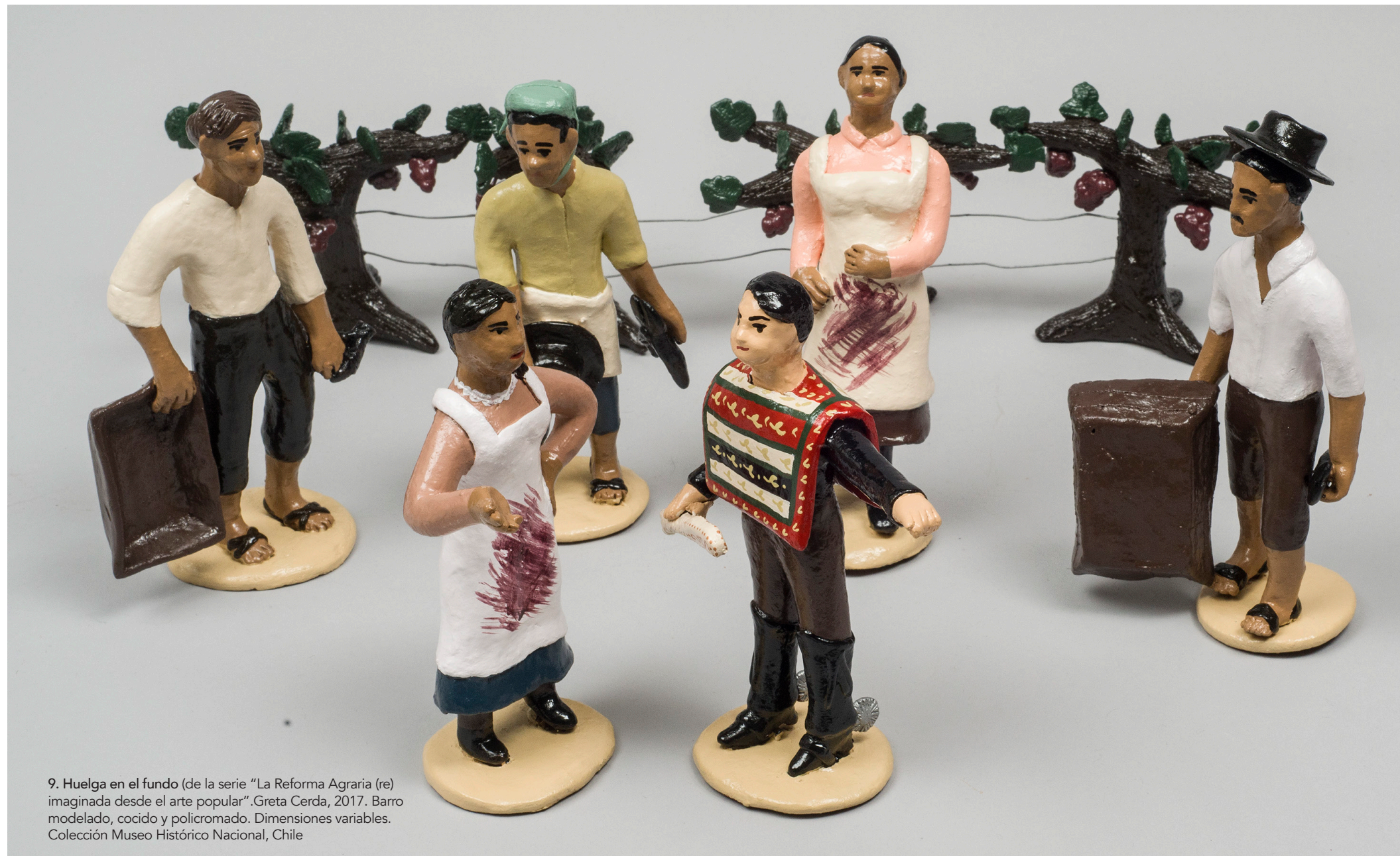
9. Huelga en el fundo (de la serie "La Reforma Agraria (re) imaginada desde el arte popular". Greta Cerda, 2017. Barro modelado, cocido y policromado. Dimensiones variables. Colección Museo Histórico Nacional, Chile