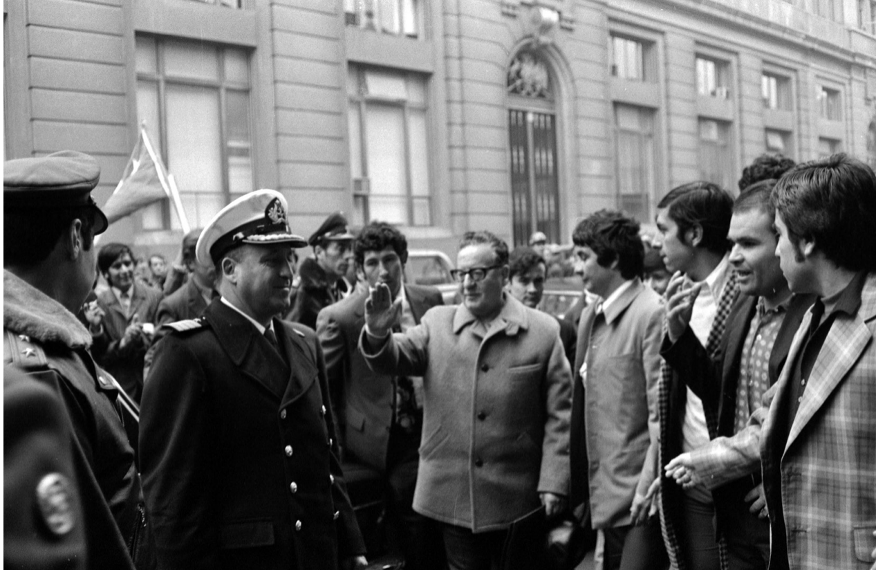
Allende llegando a La Moneda el Primero de Mayo, Armino Cardoso, 1973.