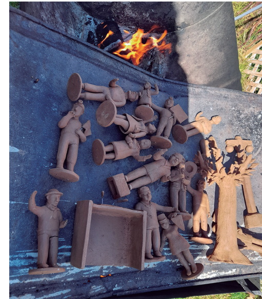
Entibiamiento de piezas para su quema