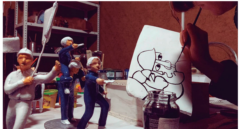
Pintura de piezas de la escena "El tarro y la brocha agarra, Brigada Ramona Parra"