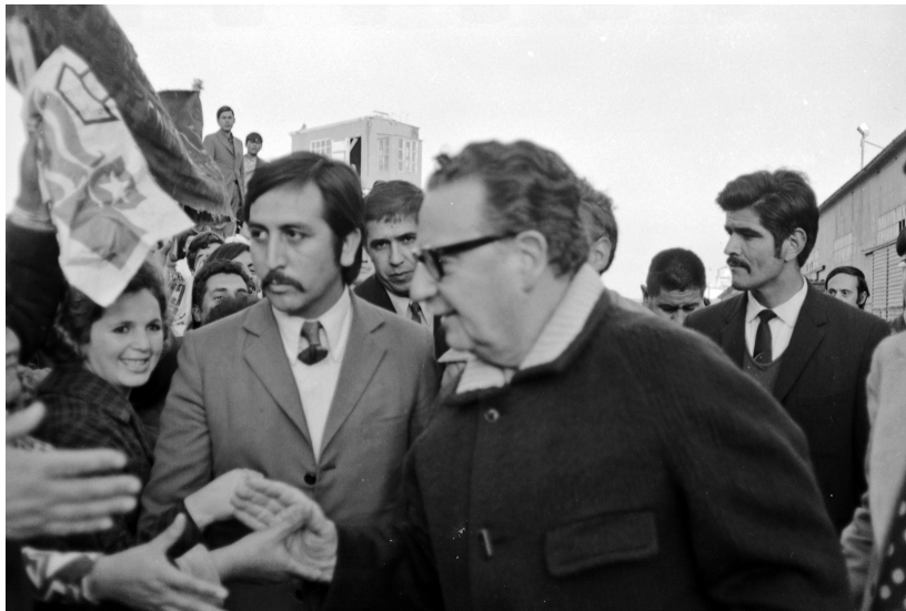
Allende en Talcahuano, Armindo Cardoso, 1973. Archivo Fotográfico Biblioteca Nacional de Chile