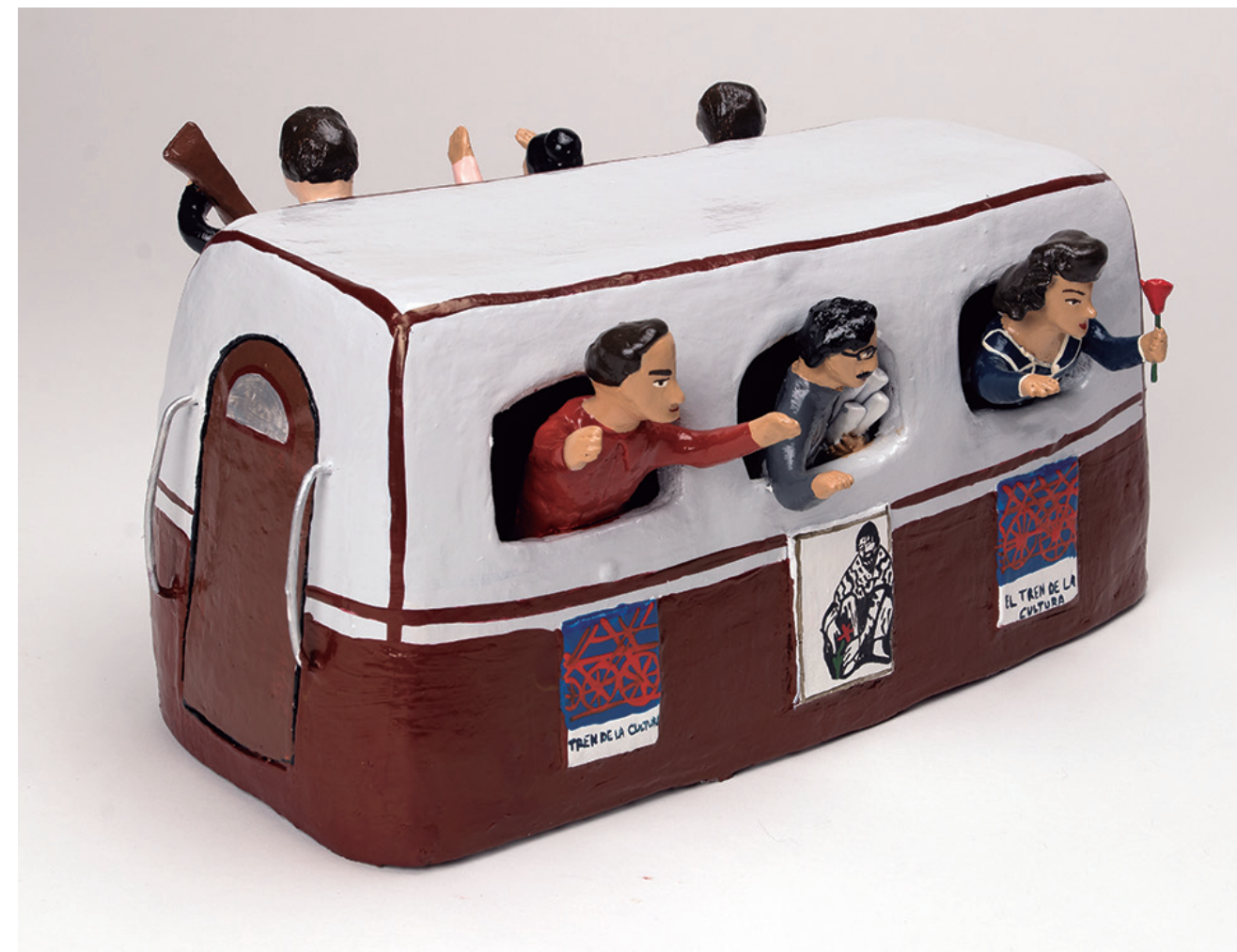
El Tren Popular de la Cultura. Greta Cerda, 2022