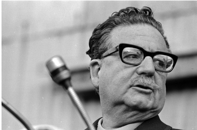
Salvador Allende, Armindo Cardoso, 1970. Archivo Fotográfico Biblioteca Nacional de Chile