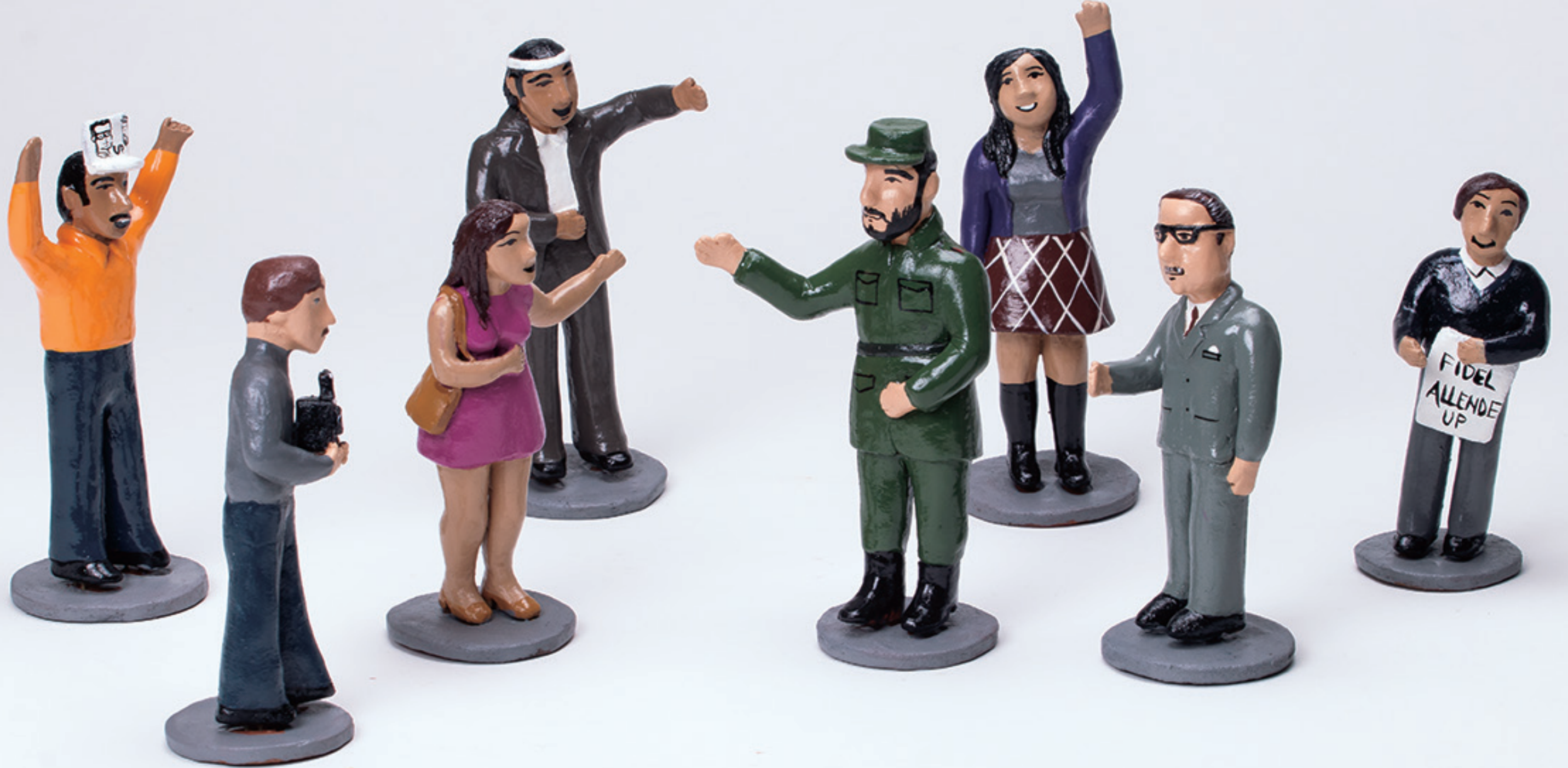
Visita de Fidel Castro a Chile.