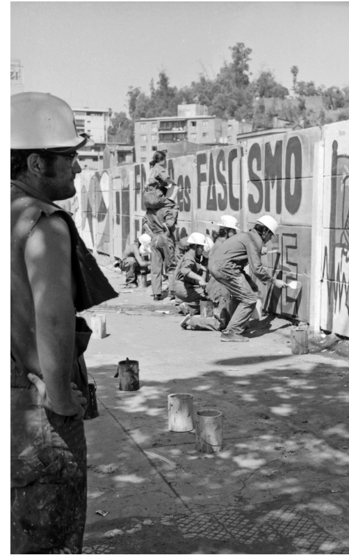
Muralistas de la Brigada Ramona Parra, Armindo Cardoso, 1970. Archivo Fotográfico Biblioteca Nacional de Chile