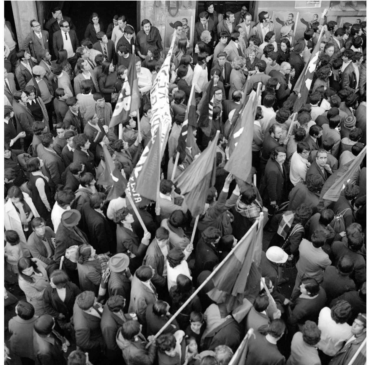
Manifestación del Primero de Mayo, Armino Cardoso, 1971.