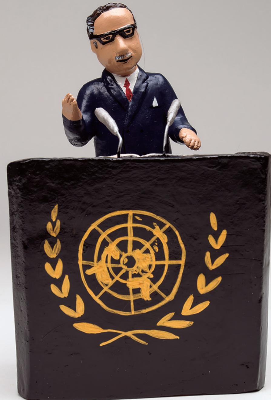
Salvador Allende en la ONU. Marta Contreras, 2022

En diciembre de 1972, el presidente Allende viaja a Nueva York para participar en la XXVII Asamblea General de la Organización de las Naciones Unidas. Su ovacionado discurso será recordado por la decidida defensa ante este importante foro mundial de los procesos de nacionalización de los recursos económicos iniciados bajo su mandato, y a la vez por el urgente llamado que realiza para superar el modelo capitalista hegemónico con el fin de eliminar las desigualdades sociales, especialmente en relación a los por entonces llamados países subdesarrollados, que históricamente han sido considerados "realidades de segunda clase". En sus propias palabras, es precisamente este modelo de exclusión generado por el capitalismo el que "la clase trabajadora chilena, al imponerse como protagonista de su propio devenir, ha resuelto rechazar, buscando en cambio un desarrollo acelerado, autónomo y propio, transformando revolucionariamente las estructuras tradicionales".