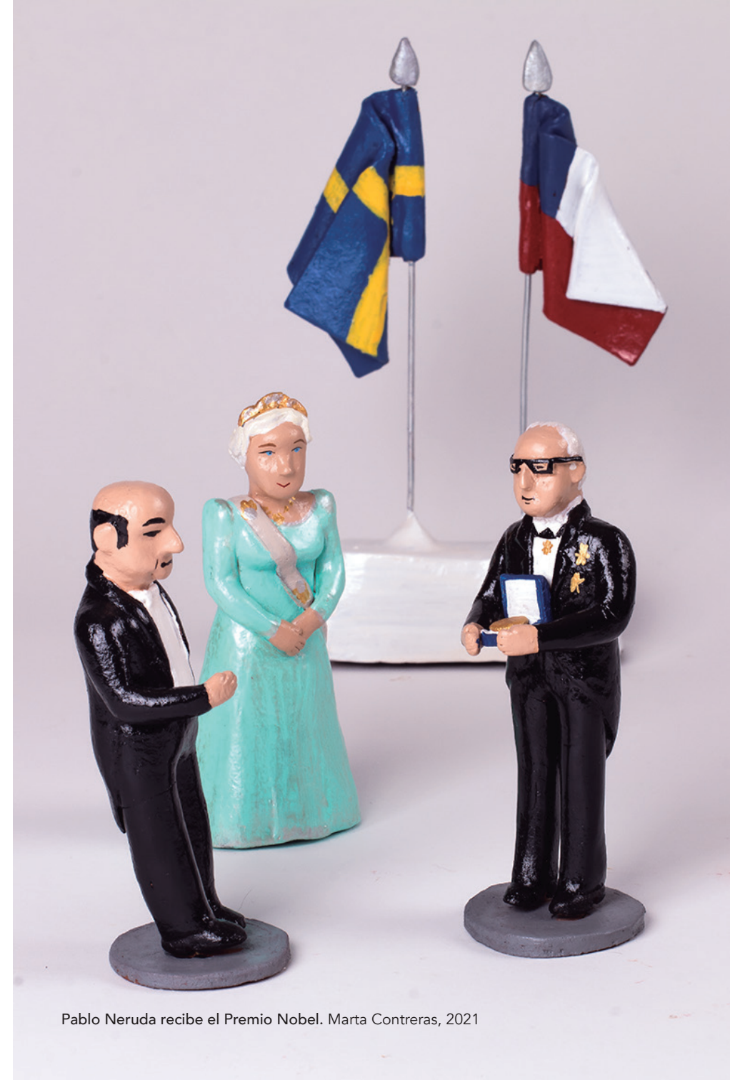
Pablo Neruda recibe el Premio Nobel. Marta Contreras, 2021

En octubre de 1971, cuando es embajador en Francia, la Academia Sueca le concede el premio Nobel por "ser autor de una poesía que, con la acción de una fuerza elemental, da vida al destino y los sueños de un continente". Se trataba de un hecho que en el contexto de esos años propició el reconocimiento hacia su obra poética del conjunto de la sociedad.