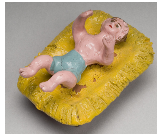
8. Misterio. Artífice popular desconocido de Talagante, 1970. Barro modelado, cocido y policromado. Colección Museo de América, España