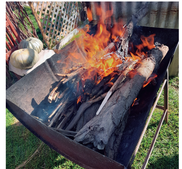
Quema de piezas a fuego directo con leña (quema ancestral)