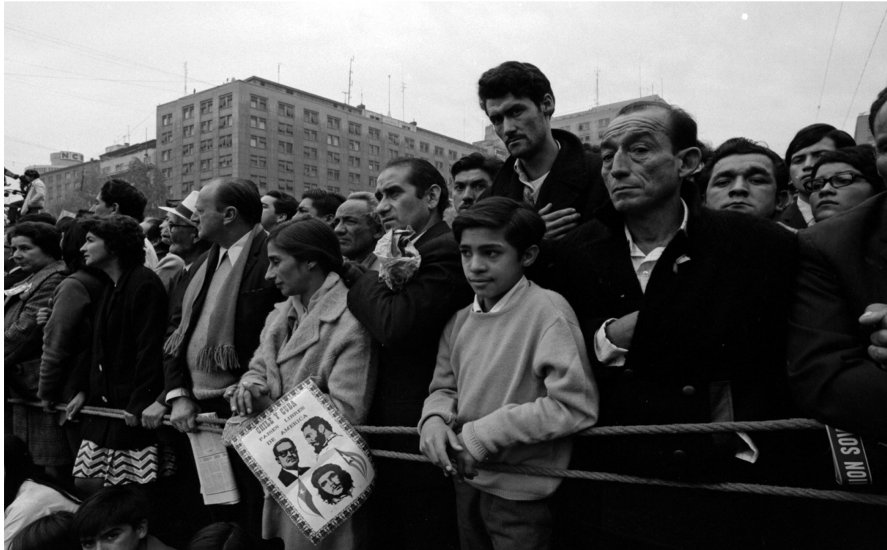
Manifestación del Primero de Mayo, Armino Cardoso, 1971. Archivo Fotográfico Biblioteca Nacional de Chile