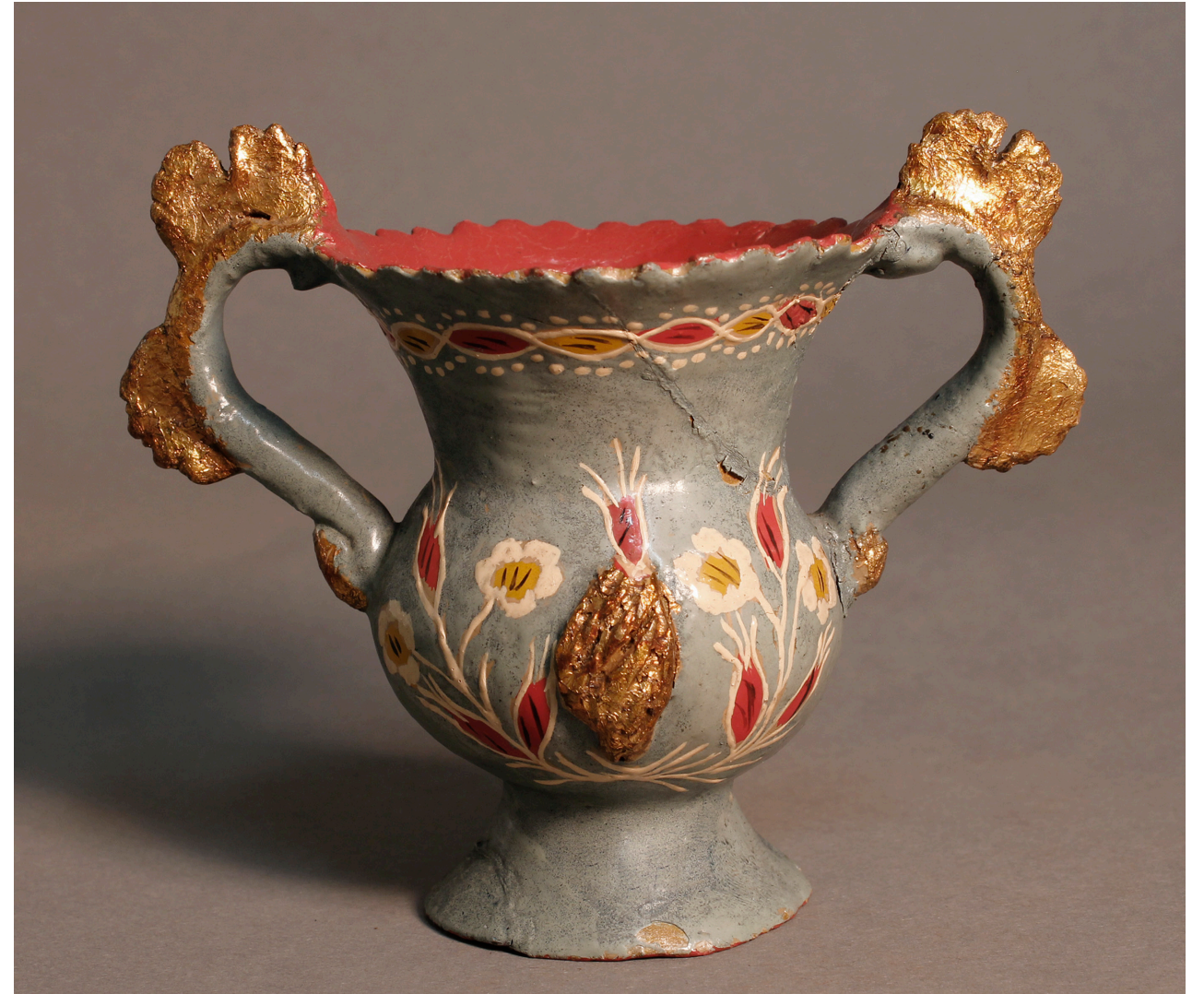
4. Vasija tipo orza con dos asas. Monja clarisa de Santiago no identificada. Siglo XIX. Barro modelado, cocido y policromado. 8,8x10x3x6,2 cm. Colección Museo Histórico Nacional, Chile