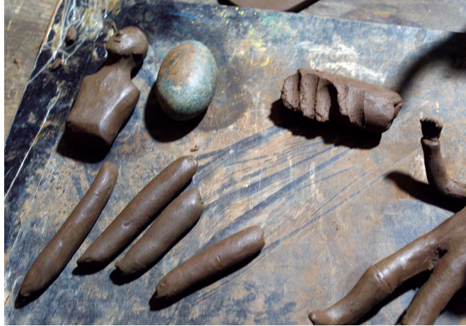
Modelado de figura humana