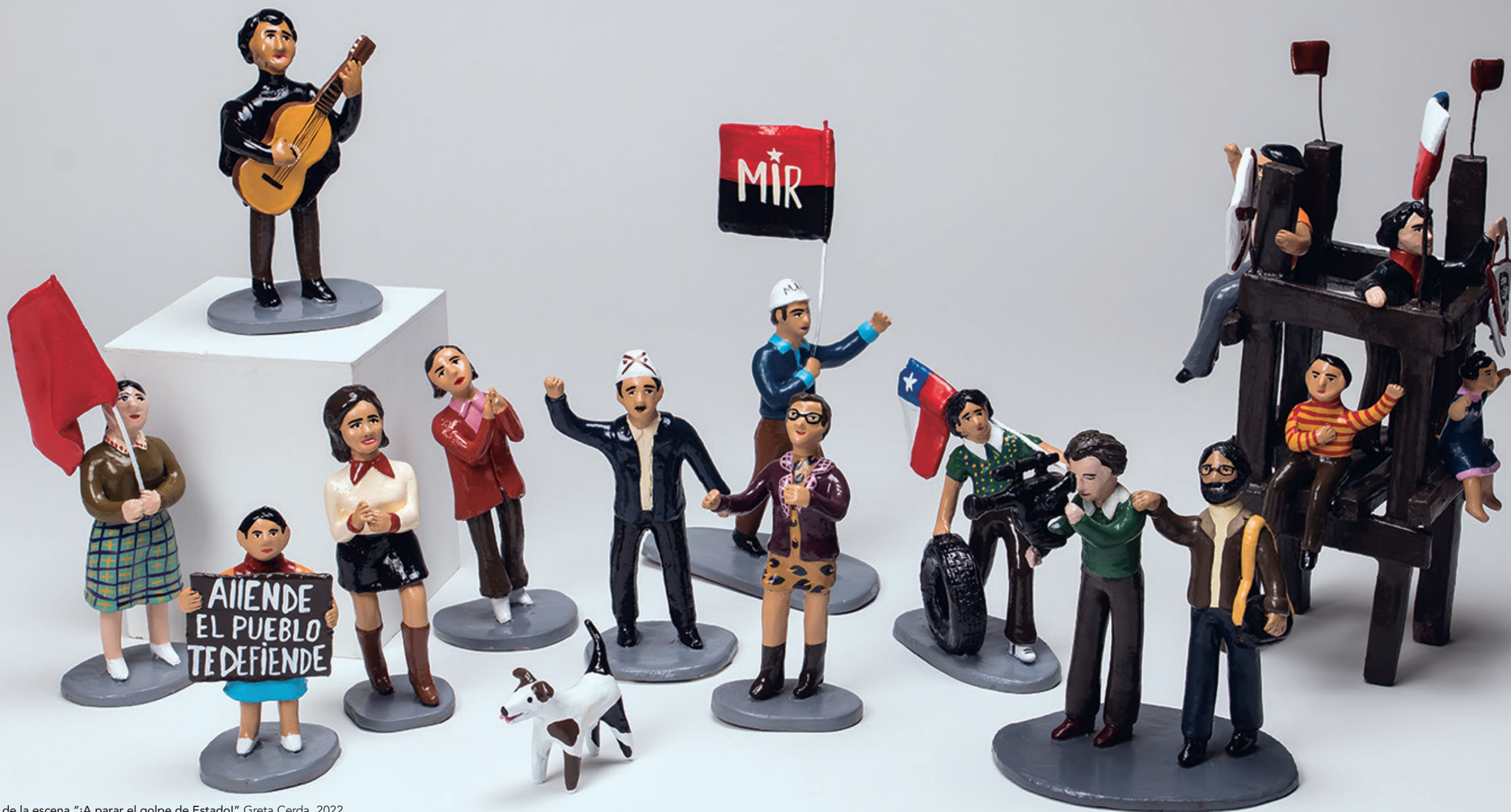
Detalle de la escena "¡A parar el golpe de Estado!" Greta Cerda, 2022