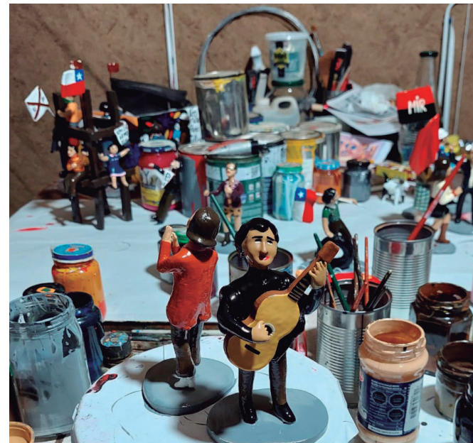
Pintura de piezas de la escena "¡A parar el golpe de Estado!"