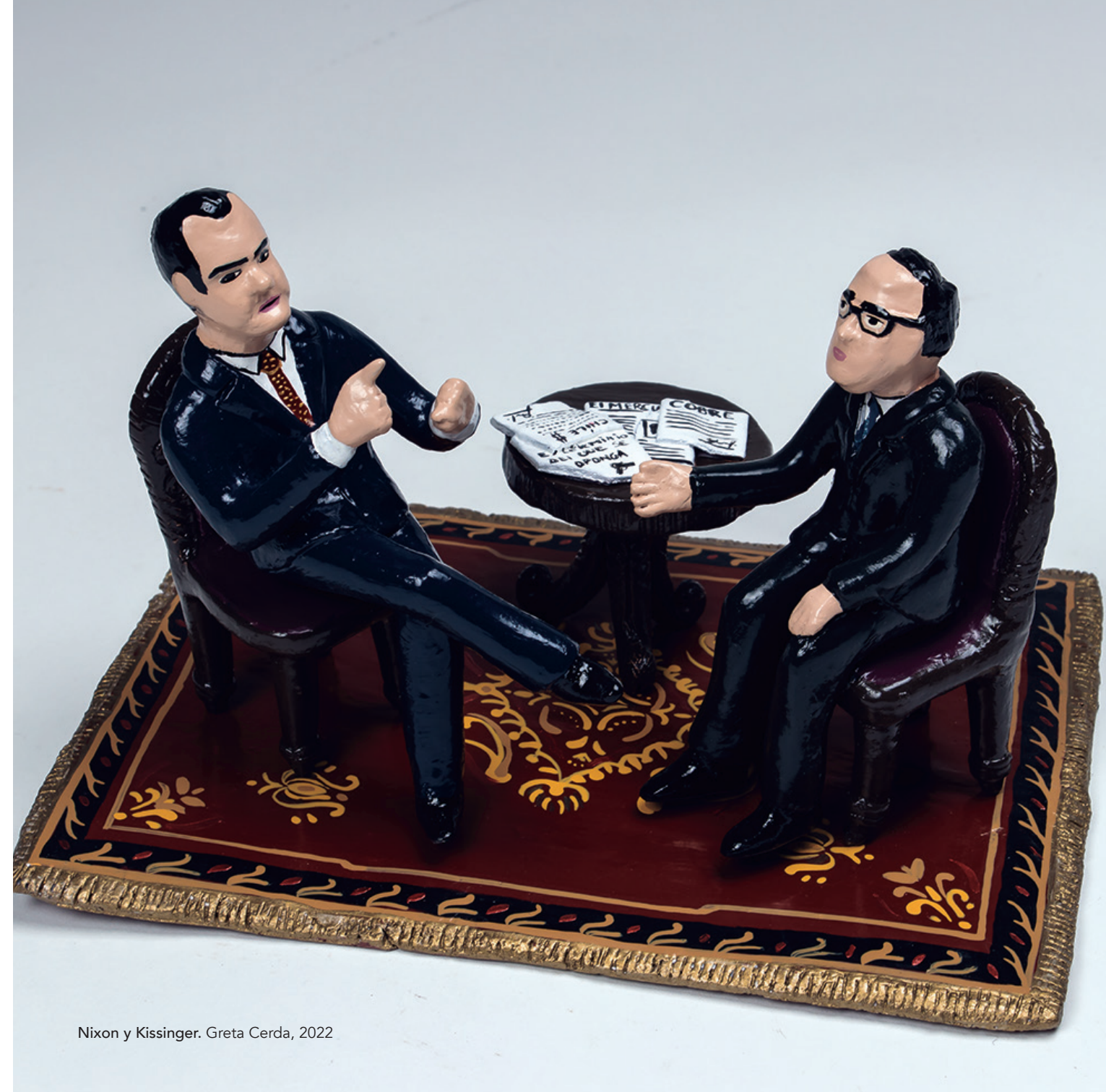
Nixon y Kissinger.

El desarrollo en América Latina de un proyecto socialista democráticamente validado en las urnas generó mucha inquietud en el gobierno de Estados Unidos, especialmente por las radicales diferencias que planteaba con lo sucedido en 1959 con Fidel Castro, quien asume el poder en Cuba a través de una revolución armada. Por lo mismo, en noviembre de 1970 el presidente Richard Nixon citó en la Casa Blanca a su Consejero de Seguridad Nacional, Henry Kissinger, para evaluar las medidas que debían ser aplicadas en Chile para asegurar el fracaso de la Unidad Popular. A partir de esa reunión, junto con las evidentes presiones económicas y diplomáticas, se desplegará en secreto todo un conjunto de planes y programas que bajo la acción de la CIA contribuirán decisivamente al golpe de Estado que puso fin no solo al Gobierno de Allende, sino también al sistema democrático chileno.