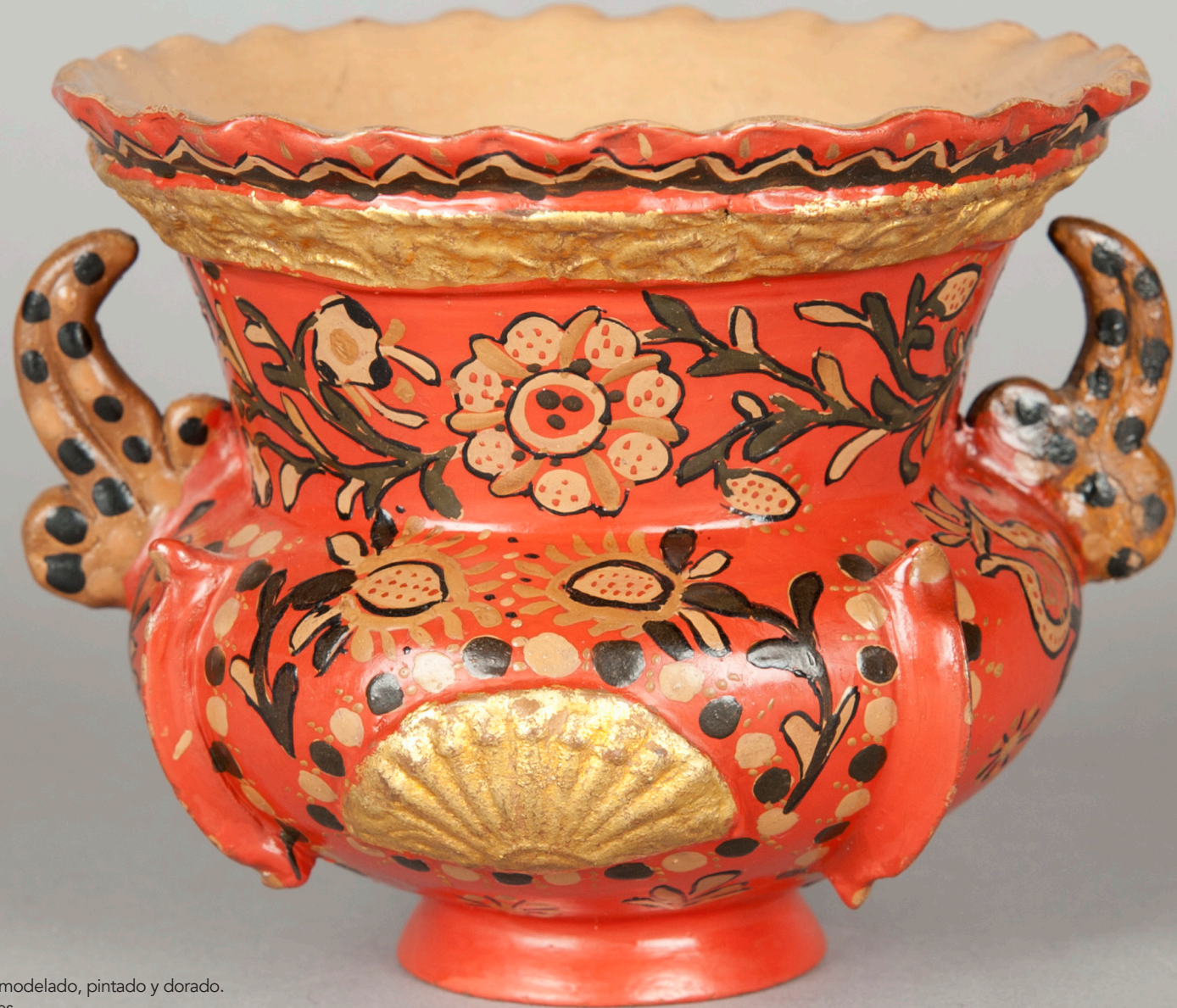
2. Vasija de las Monjas de Santa Clara (Santiago de Chile). Barro modelado, pintado y dorado. Siglo XVIII. Museo de América (Madrid).