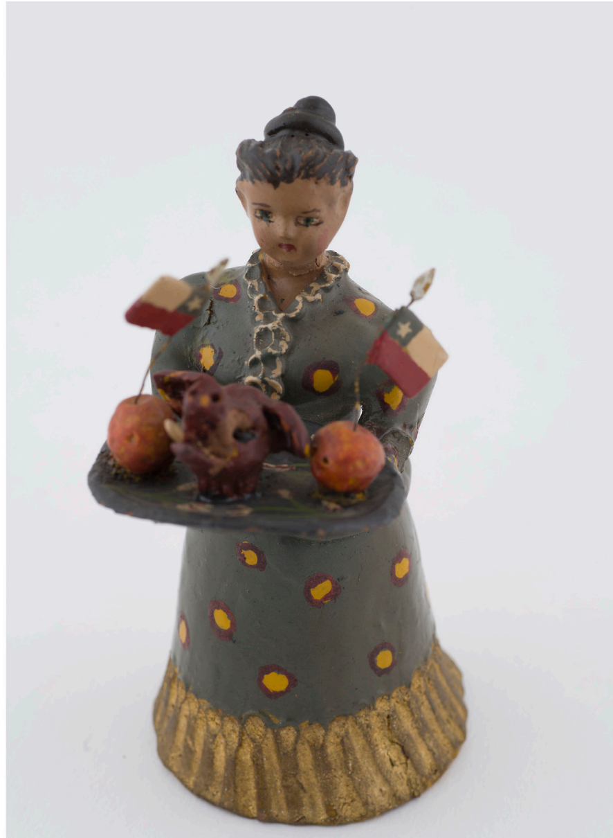
7. Mujer portando bandeja. Sara Gutiérrez, 1949. Barro modelado, cocido y policromado 10x4,5x4,5 cm. Colección Museo Histórico Nacional, Chile