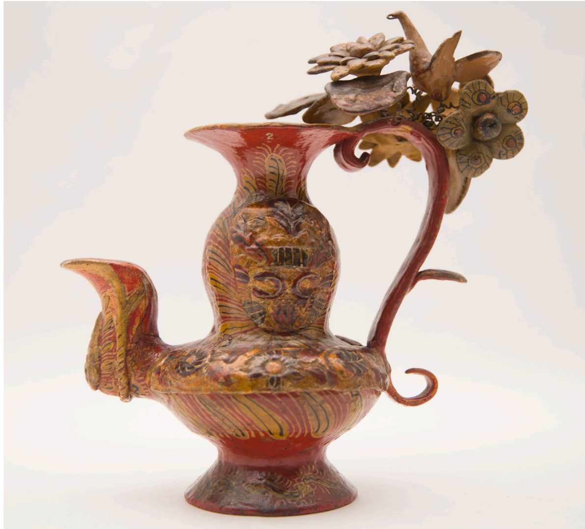
3. Tetera pichel. Monja clarisa de Santiago no identificada. Siglo XIX. Barro modelado, cocido y policromado. 22x12x16 cm. Colección Museo Histórico Nacional, Chile