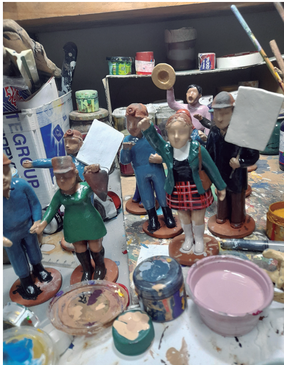
Proceso de pintado de piezas en taller