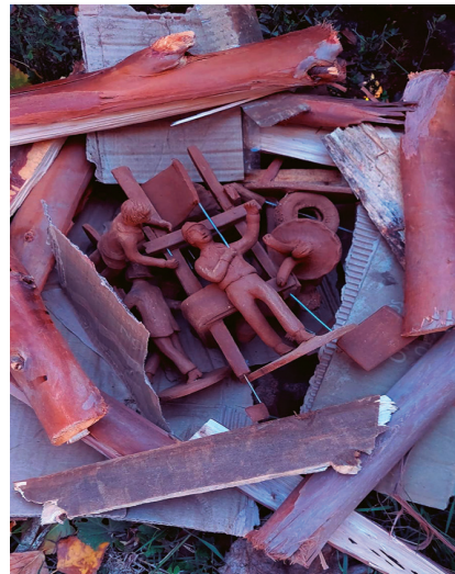
Preparación de piezas para la quema