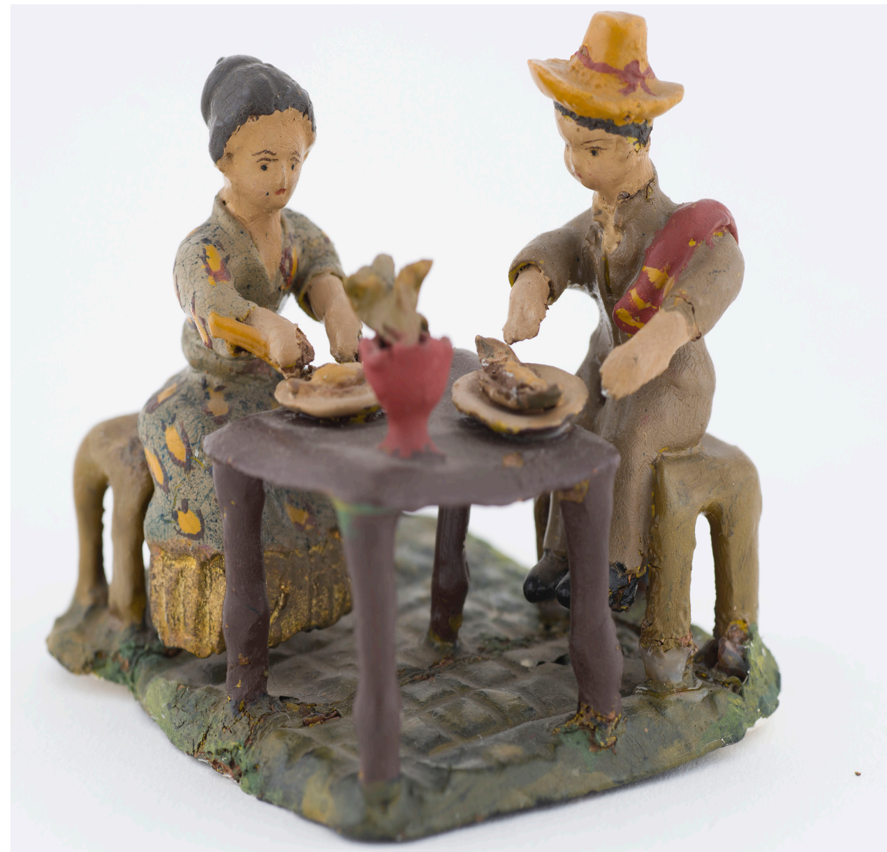
6. Personajes comiendo empanadas. Sara Gutiérrez, 1942. Barro modelado, cocido y policromado. 6,6x7,3x6,5 cm. Colección Museo Histórico Nacional, Chile