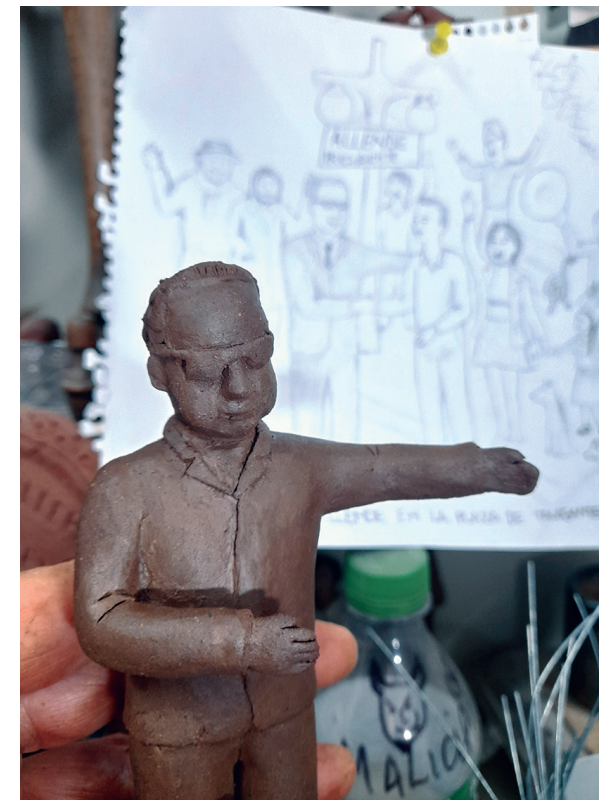
Modelado de figura de Salvador Allende