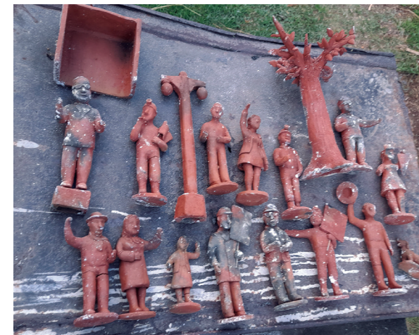
Piezas ya quemadas, enfriadas para su traslado al taller