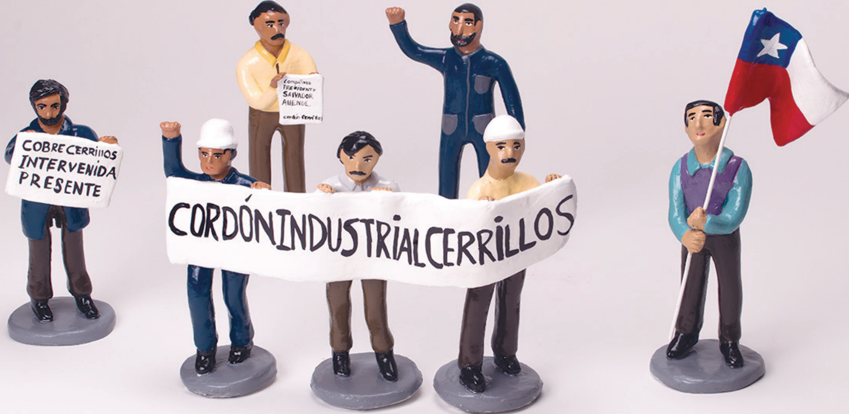
La unión y fuerza de los trabajadores (los cordones industriales). Greta Cerda, 2022