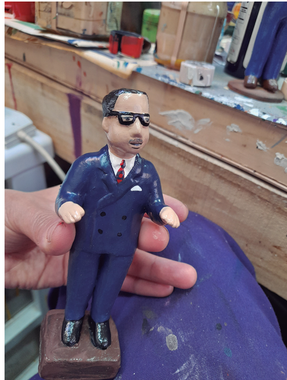
Proceso de pintado ya terminado de la figura Salvador Allende. Escena "Allende en la ONU"