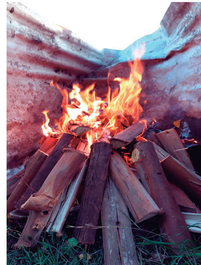
Quema de piezas con fuego directo