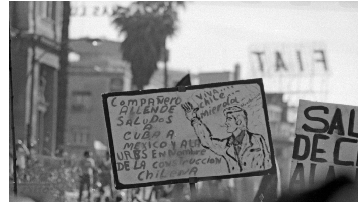
Cartel de una manifestación, Armino Cardoso, 1972.