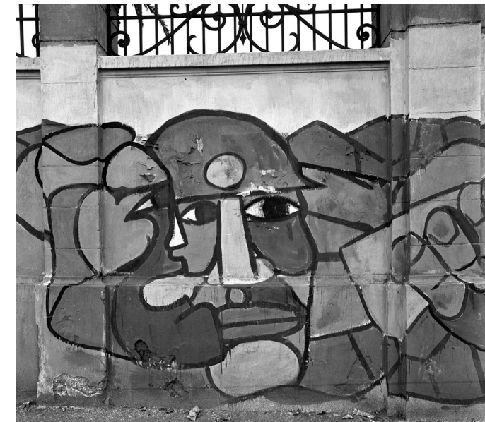
Murales políticos, Armindo Cardoso, 1970. Archivo Fotográfico Biblioteca Nacional de Chile