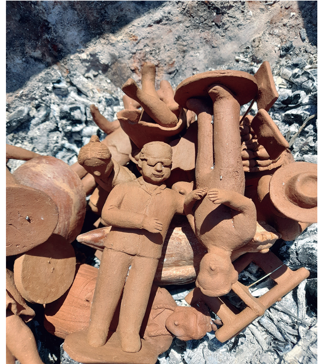
Preparación de piezas para quema a fuego vivo